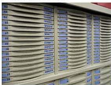
Tiroirs hauteur 25 mm (utile : 17 mm)