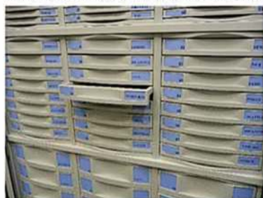
Tiroirs hauteur 50 mm (utile : 38 mm)

Tous les tiroirs sont interchangeables et faciles à manier.