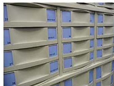
Tiroirs hauteur 100 mm (utile : 84 mm)