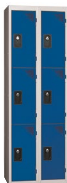
Version L.30 cm