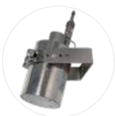
Extincteur EX100LI/EX200LI (option)