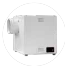
Caisson de ventilation CDV-A (option)