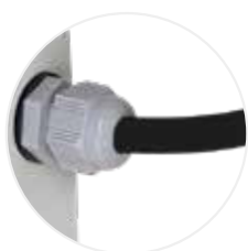
Passage des câbles PEXTBALI14 (option incluse avec PRISELI14)