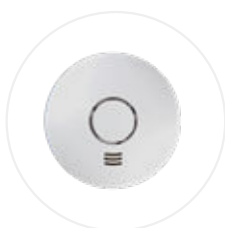
Détecteur de fumée connecté ALARMWI (option)