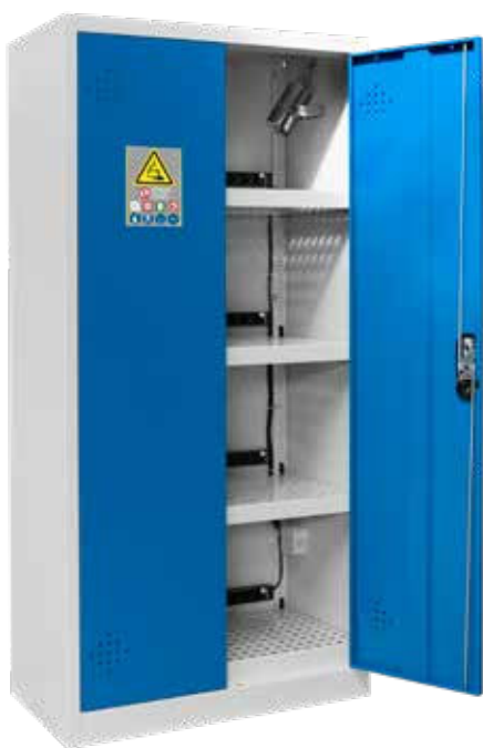
▲ AZ301BLI + 4 PRISELI14 + EX200LI + PEXTBALI14