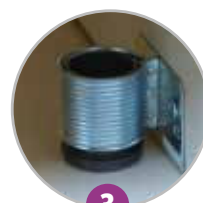
3 Pieds vérins pour mise à niveau