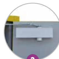
2 Ferme-porte avec thermofusible