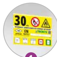
1 Pictogramme normalisé