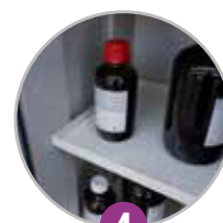
4 Étagères de rétention