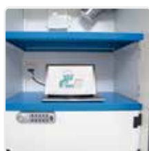
Casier équipé d'une prise