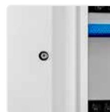
Serrure à clef de série