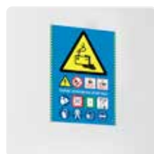
Pictogrammes normalisés sur la porte